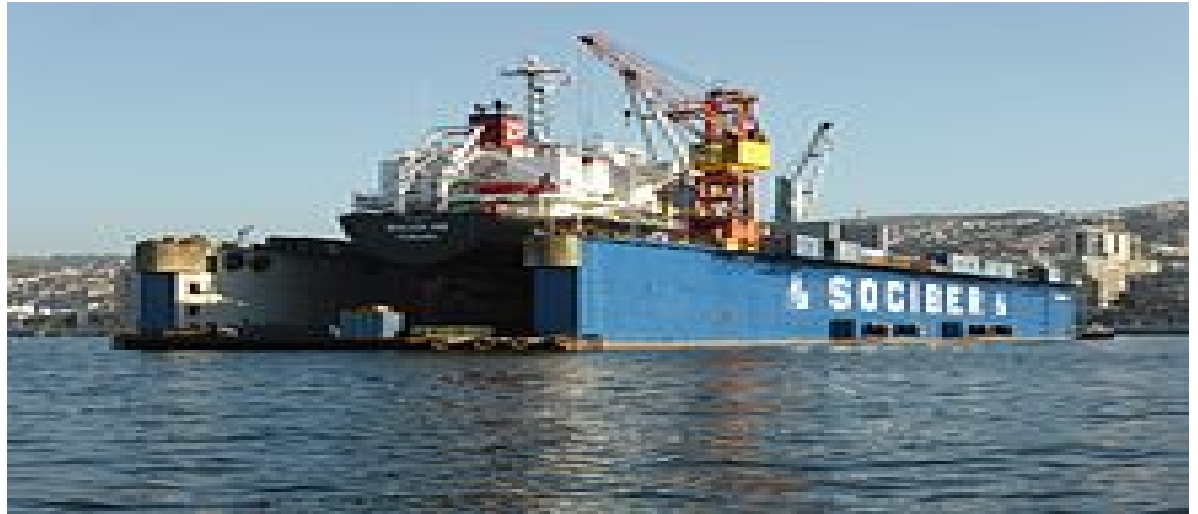
DIQUE FLOTANTE PUERTO VALPARAISO