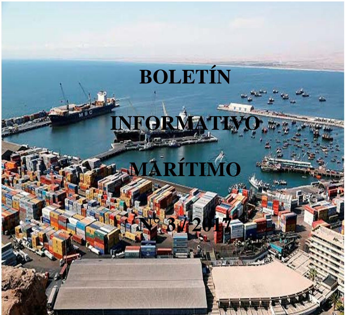
Puerto de Arica