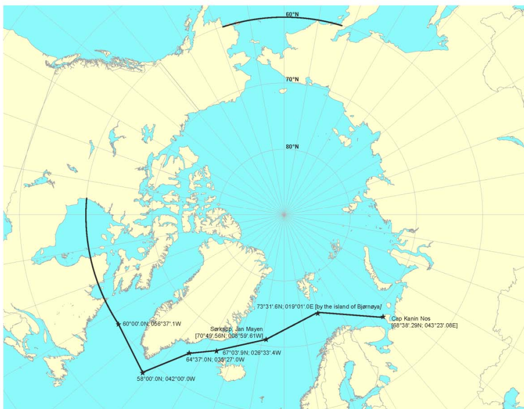
Figura 2: Extensión máxima del ámbito de aplicación en aguas árticas 3