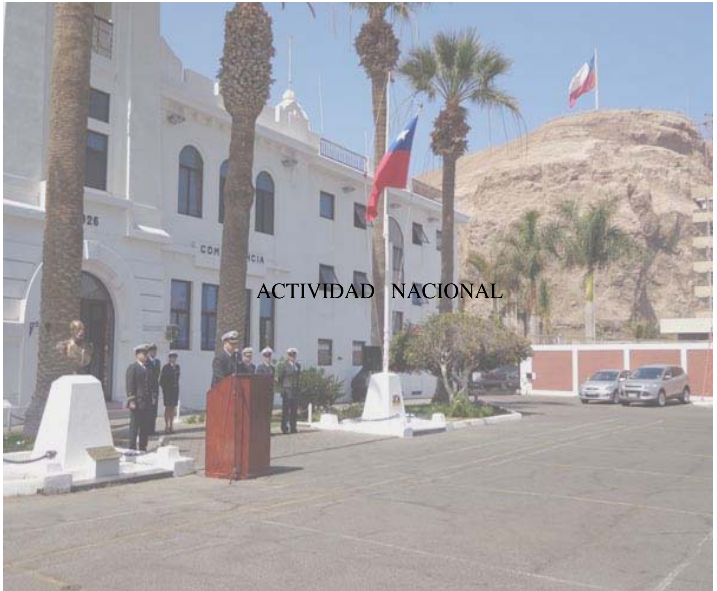
Ceremonia Aniversario Fiestas Patrias G.M. Arica.