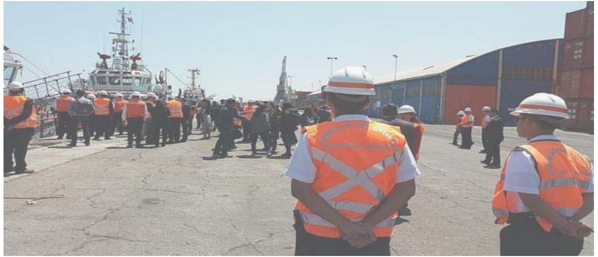
Visita Cancilleres de Chile y Paraguay a Antofagasta