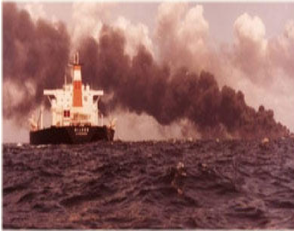
Derrame en el Mar Caribe, en 1979, por la colisión de un buque con el superpetrolero “Atlantic Empress.”