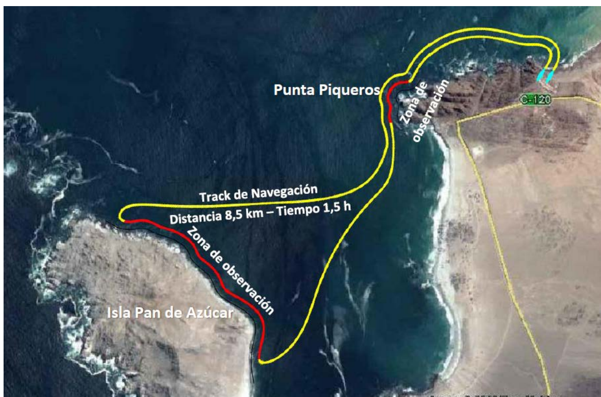
Fig.2. Track de navegación de turismo a la Isla Pan de Azúcar.