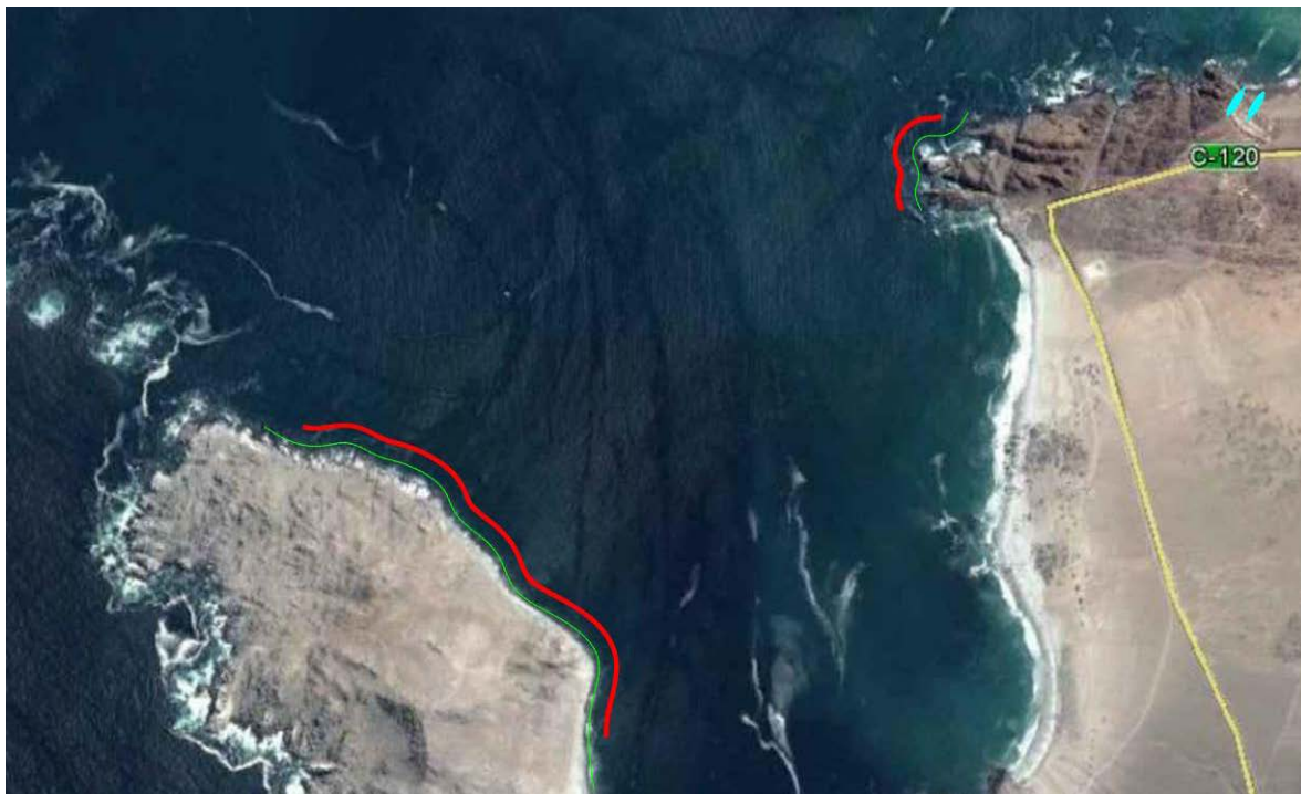
Fig.1. Áreas de observación de especies hidrobiológicas.

Se establece un track de navegación fijo de 4,6 millas náuticas desde la Caleta Pan de Azúcar a la Isla donde se incluyen las zonas de observación de fauna más relevantes dentro del área del Parque Nacional Pan de Azúcar.