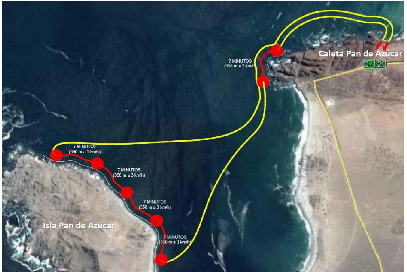
Fig.5. Distancia mínima entre embarcaciones en pasos complejos.