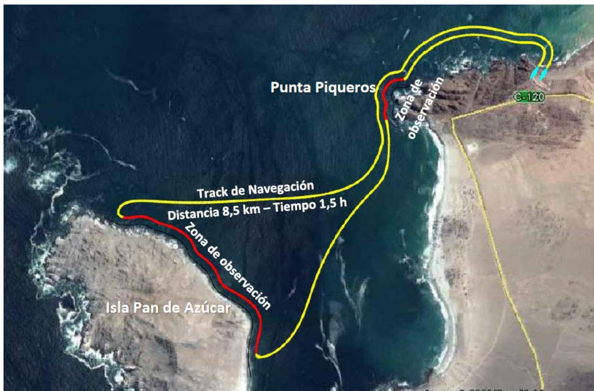
Fig.2. Track de navegación de turismo a la Isla Pan de Azúcar.